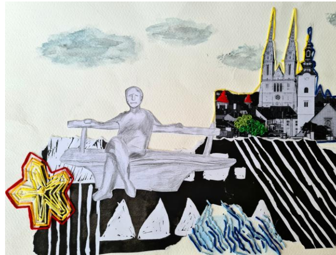
Ivan Kožarić, „Antun Gustav Matoš“, 1978., aluminij

Kip prikazuje Matoša kako sjedi na klupi, zamišljen i kako promatra svijet oko sebe. Otvorena kompozicija, odnosno sama skulptura Matoša poziva prolaznika da sjedne pored njega i porazgovara s njim. Na taj se način prolaznik povezuje s javnim prostorom.