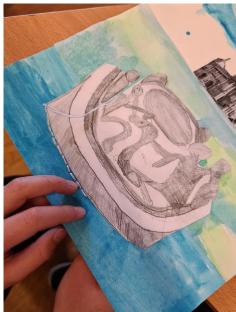
Ivan Meštrović, „Zdenac života“, 1912., bronca

Kip zdenca je napravljen 1905. godine, a postavljen je u Zagrebu 1912. ispred HNK (Hrvatsko narodno kazalište). Visok je 125 cm. Tijela oko zdenca izgledaju kao prava tijela zamrznuta u vremenu. Prikazuju sreću i bezbrižnost. Kip od bronce postavljen je na bijele kamene ploče.