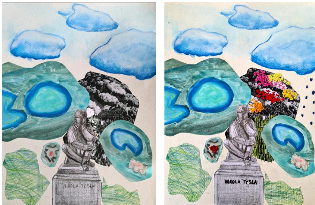
Ivan Meštrović, „Nikola Tesla“,1956., bronca

Ovaj veliki kip je brončani spomenik Nikoli Tesli, legendarnom izumitelju i elektrotehničaru. Tesla je zaslužan za brojne značajne izume u području elektrotehnike, magnetizma i komunikacije te je odigrao veliku ulogu u oblikovanju svijeta kakvog poznajemo.