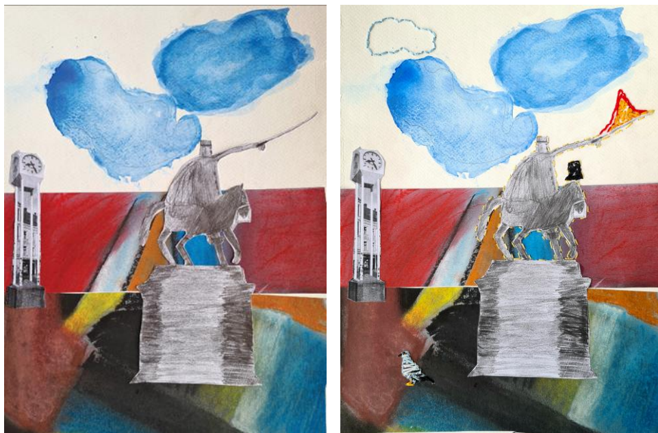
Anton Dominik Fernkorn, „Ban Josip Jelačić na konju“, 1863., bronca

Josip Jelačić bio je hrvatski političar i vojskovođa. Rođen je 16. listopada 1801. u Petrovaradinu (danas Srbija). Titula „ban“ označavala je upravitelja pokrajine. Josip je bio vojni vođa Hrvatske. Kip bana Jelačića nalazi se na Trgu bana Jelačića. U početku je kip bio okrenut prema sjeveru jer smo bili u ratu s Mađarskom, a sada je okrenut prema jugu zbog rata sa Srbijom (1991. – 1995).