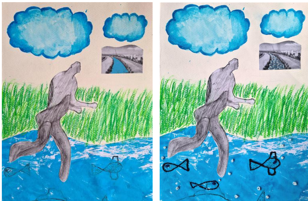
Marija Ujević, „Trkač“, 1955., bronca

Ovaj kip nalazi se uz rijeku Savu u Zagrebu. Osmišljen je kao polu-apstraktno djelo koje simbolizira energiju, brzinu i eleganciju. Prikazuje gracioznost ljudskog tijela u pokretu.