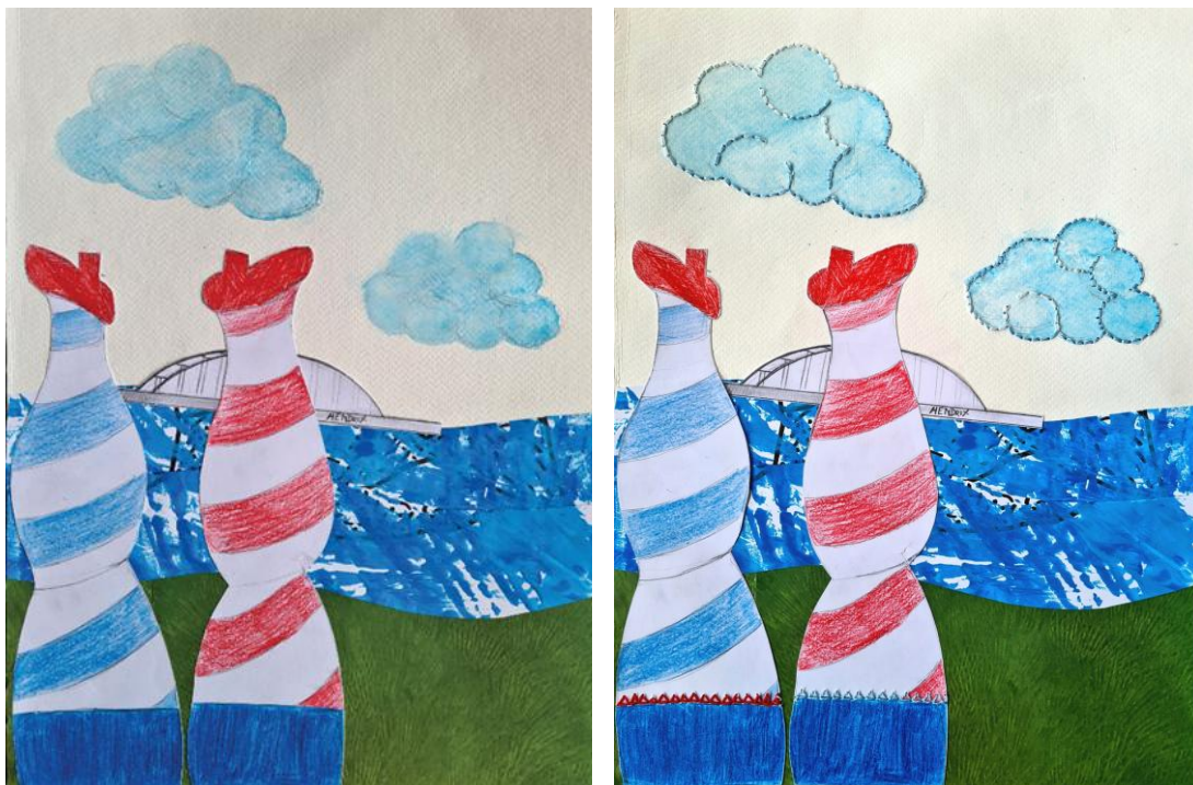
Zvonimir Lončarić, „Putokaz“, 2008., beton

Skulptura „Putokaz“ dio je koncepta Parka skulptura kao jedinstvenog gradskog prostora u kojem građani mogu doživjeti umjetnička djela bez posrednika, u obliku otvorene galerije – besplatno i u bilo koje doba godine, dana ili noći. Mogu ih dodirnuti, sjesti na njih ili se pak s djecom poigrati u neobičnom i zanimljivom parku. Skulptura „Putokaz“ prikazuje ženske noge i podsjetnik je na nekadašnje popularno savsko kupalište, tzv. „babinjak“, kojeg se Zagrepčani s nostalgijom sjećaju.