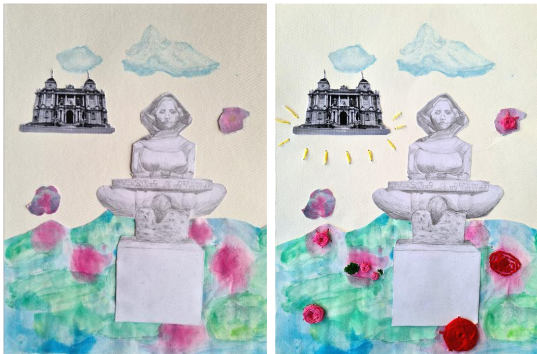
Ivan Meštrović, „Povijest Hrvata“,1932., bronca i mramor

Zadivljujuća skulptura „Povijest Hrvata“ napravljena je 1932. godine. Prvotno je bila namijenjena za Stari hrvatski muzej u Kninu. Ovo umjetničko djelo predstavlja snažan simbol kulturnog i povijesnog ponosa Hrvatske. Ženski lik u skulpturi odjeven je u stiliziranu dalmatinsku narodnu nošnju i vjeruje se da predstavlja umjetnikovu majku. U krilu drži kamenu ploču na kojoj je glagoljicom (drevnim slavenskim pismom) urezan naziv djela. Skulptura simbolizira brižnu majku i čuvaricu hrvatske baštine, ističući važnost očuvanja nacionalne povijesti.